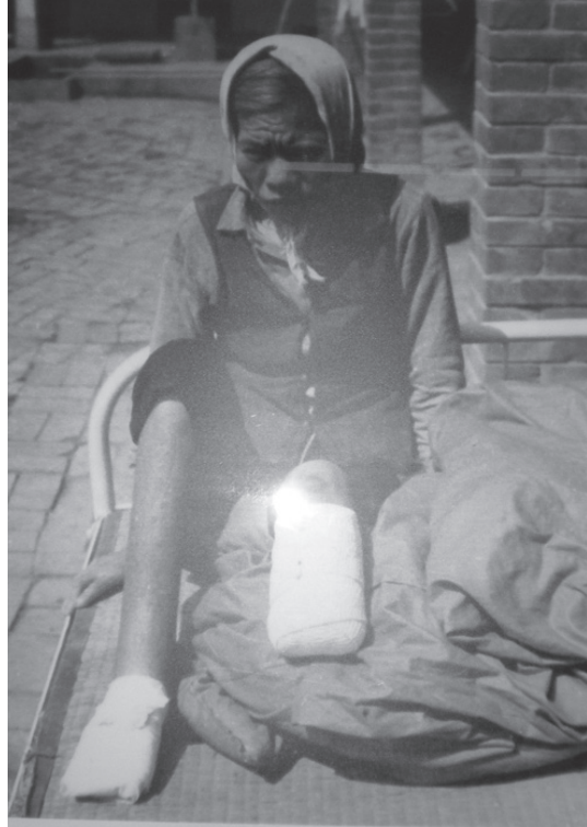
手術完後の烏脚病患 Blackfoot disease patient after surgery.