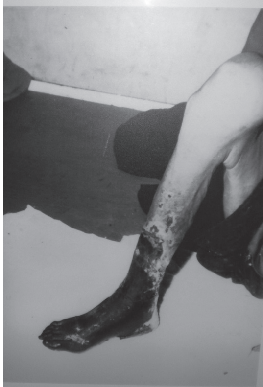
烏脚病患病發的狀態 Symptom occurred on Blackfoot disease patient.